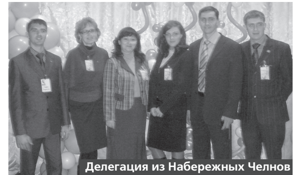
Делегация из Набережных Челнов