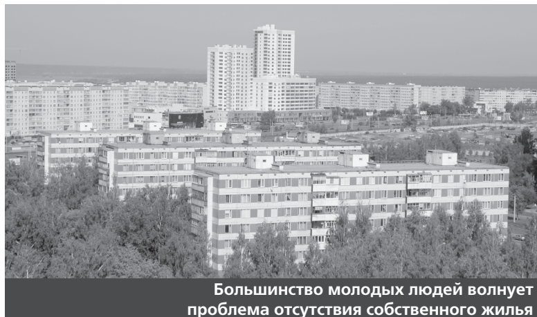
Большинство молодых людей волнуется проблема отсутствия собственного жилья