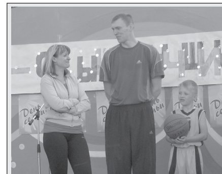
Чей папа самый лучший?