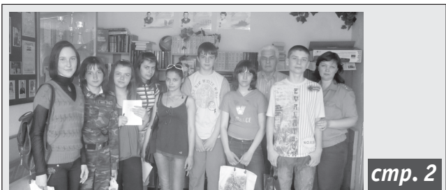
На экскурсии Автозаводского ОВД