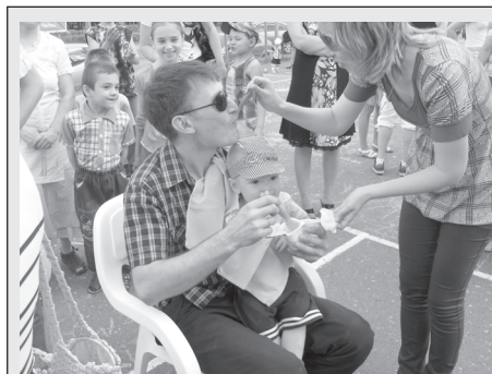
День семьи в МЦ «Заман»