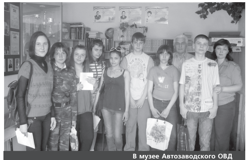
В музее Автозаводского ОВД

и объяснили, что на его фоне делают снимки нарушителей порядка. В оружейной комнате мы узнали, что пистолеты ежедневно выдаются на время дежурства, а потом их сдают обратно. А если оружие понадобится для соревнований, то нужно написать рапорт на имя начальника. На одном из этажей нам предложили снять отпечатки пальцев, и я вызвался. Сначала сняли отпечатки с кончиков четырех пальцев на обеих руках, потом — со всей руки и подарили листочек с отпечатками на память. Отмыть руки потом непросто, но зато было весело.