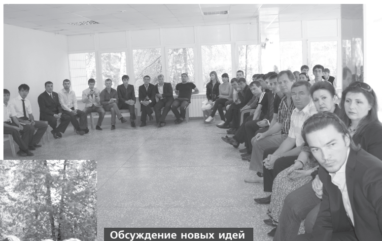
Обсуждение новых идей

В нем также приняли участие официальные лица из структур государственной и муниципальной власти, руководители общественных организаций, успешные