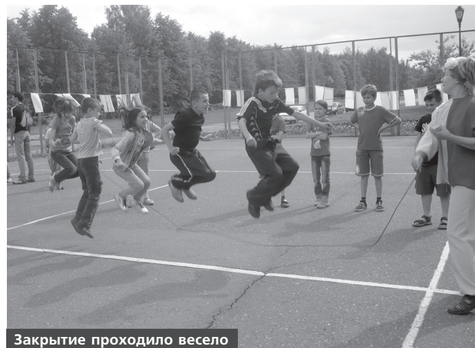
Закрытие проходило весело

На протяжении всего лета на территории молодежного центра «Заман» работала детская досуговая площадка «Мультидвор», объединившая детей со всего комплекса.